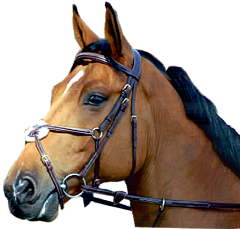
Messicana (ammessa solo con filetto)