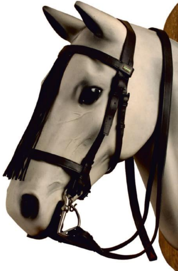
Cinturino Chiudibocca passato all'altezza dei montanti dell'imboccatura ammessa sia con il filetto che con il morso