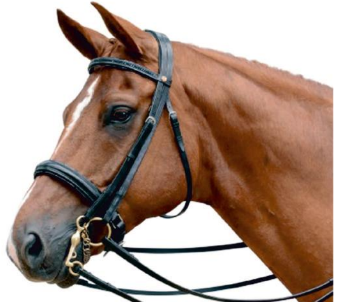
Inglese (con filetto, con morso, con briglia)