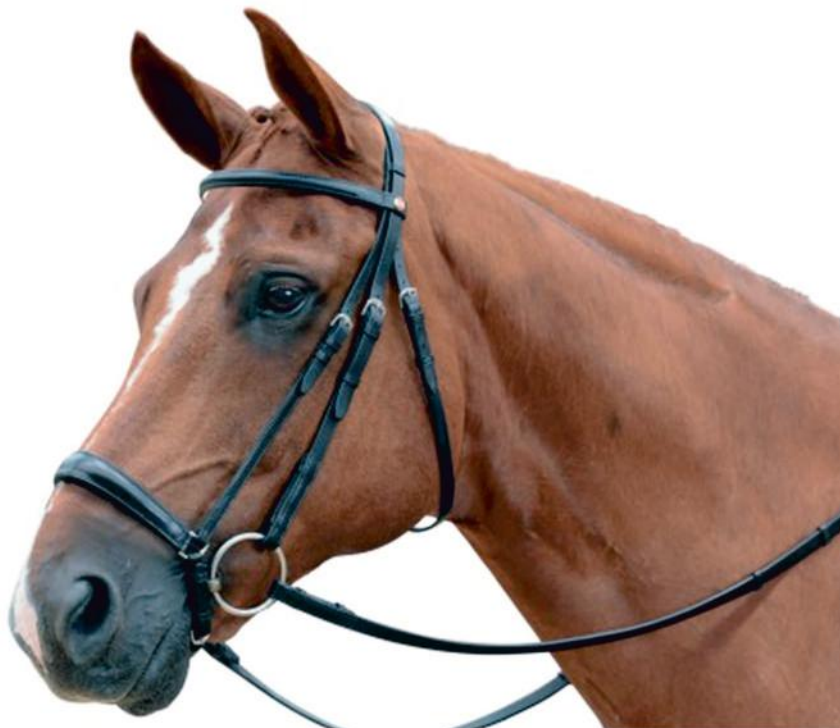
Tedesca con chiudibocca con anelli. Chiusa davanti all'imboccatura: ammessa solo con filetto; chiusa dietro all'imboccatura: ammessa con filetto e morso