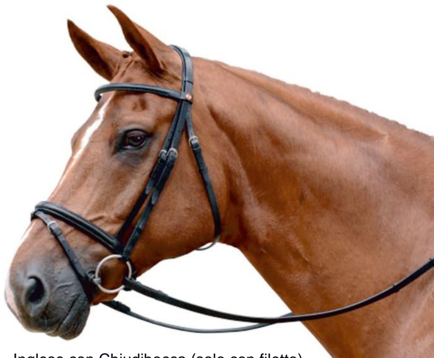
Inglese con Chiudibocca (solo con filetto)