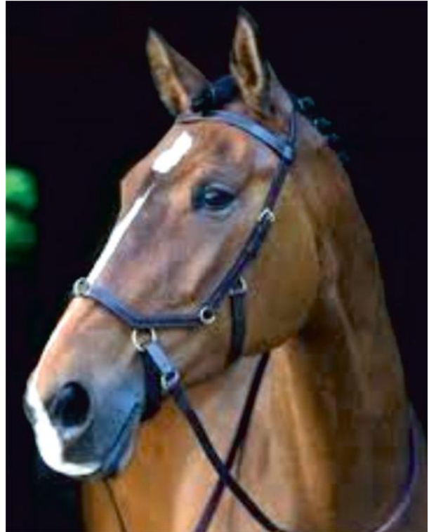
Micklem (con filetto e senza alcuna imboccatura) Chiusa davanti all'imboccatura: ammessa solo con filetto; chiusa dietro all'imboccatura: ammessa con filetto e morso